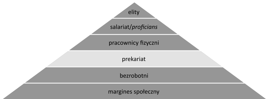
Rysunek 2. Kategorie społeczne według G. Standinga

jest kategorią, którą G. Standing umiejscawia (rys. 2) między bezrobotnymi oraz pracownikami fizycznymi (dawniej określanymi jako proletariatu). Jednocześnie zaś wyróżnia trzy właściwe mu cechy: niepewność pracy, niepewność dochodu oraz brak tożsamości opartej na pracy, czyli brak tożsamości zawodowej (Standing 2014, s. 52).